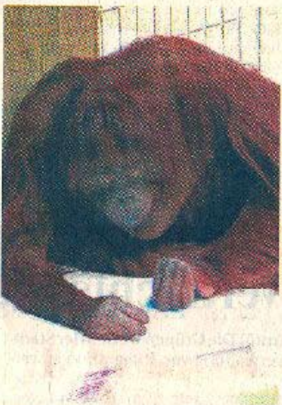
Affendame Sita schwingt konzentriert den Wachsmalstift.