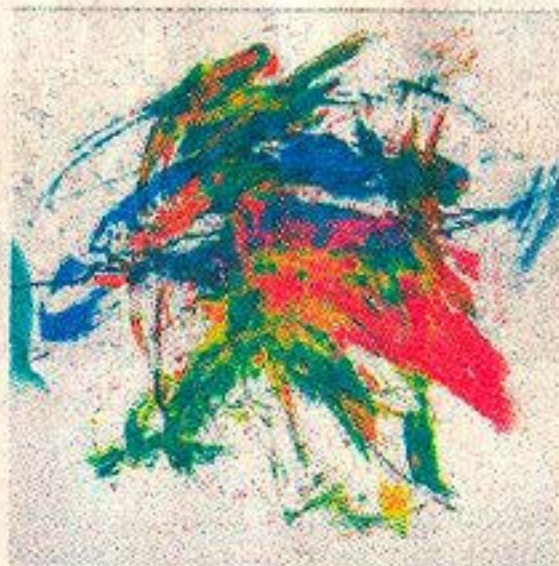
Das teuerste Werk: 840 Euro kostet dieses Ölbild.

Norbert Potthoff, Krefelder Maler, würde sich wünschen, dass der Zoo statt der Gorillas mehr Künstler